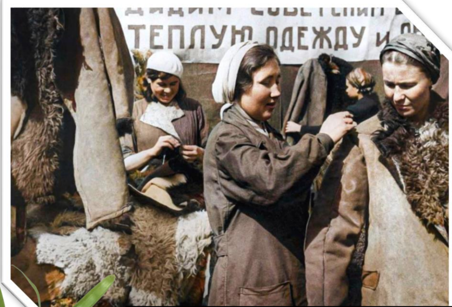
Женщины на производстве полушубков для фронта. Казанский кожевенный завод. Казань, 1942 год