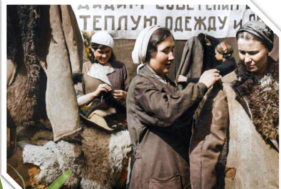
Женщины на производстве полушубков для фронта. Казанский кожевенный завод. Казань, 1942 год