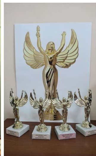
Церемония награждения муниципального конкурса «БиблиоНика-2023» Усть-Лабинский район