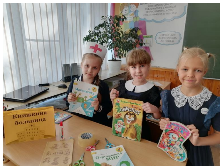
МБОУ СОШ № 6 Акция «Подари книге вторую жизнь»