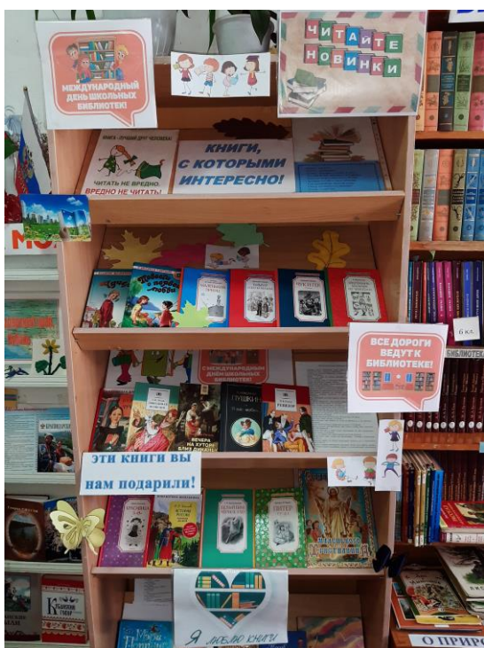
Книжная выставка МБОУ СОШ № 37 ст. Алексеевской

Представленная общеобразовательными организациями Краснодарского края информация и фотоотчеты о проведенных мероприятиях, позволяют сделать вывод, что в течение Месячника были задействованы все группы читателей, активно популяризировались книги и чтение среди обучающихся, наблюдался рост читательской активности, увеличилось количество посещений библиотеки и выдачи книг, пополнились библиотечные фонды. Проведенные в рамках Месячника мероприятия подтвердили важность и значимость школьных библиотек для создания развивающей информационно-образовательной среды, способствующей качеству обучения и духовно-нравственному воспитанию обучающихся.