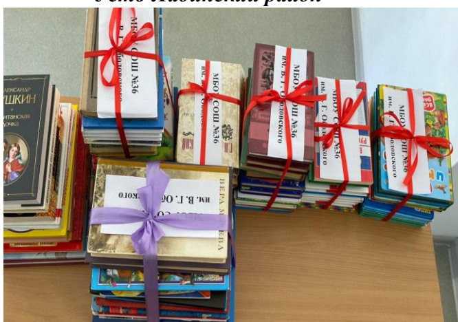
МБОУ СОШ № 36 Усть-Лабинский район Акция «Подари книгу библиотеке»