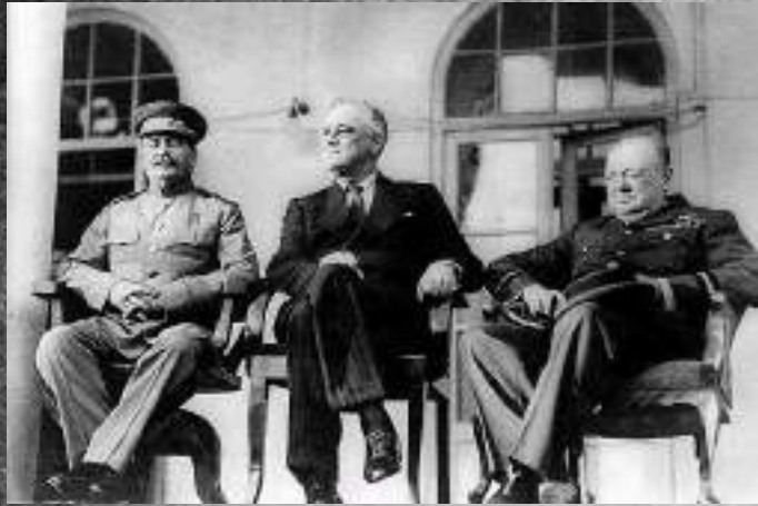
СССР, США и Великобритании И. Сталин, Ф. Рузвельт, У. Черчилль в ходе Тегеранской конференции 1943 г.