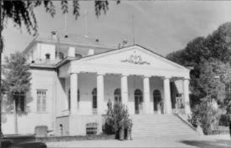
Посольство СССР в Тегеране