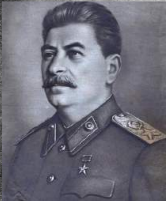
Иосиф Виссарионович Сталин, руководитель СССР с 1927— 1953года

11 июня И.В. Сталин направил президенту США ответ на его сообщение о решениях, принятых в Вашингтоне. Текст этого ответа был направлен также У. Черчиллю. В нем указывалось, что новая отсрочка англо-американского вторжения в Европу «создает исключительные трудности для Советского Союза, уже два года ведущего войну с главными силами Германии и ее сателлитов с крайним напряжением всех своих сил, и предоставляет Красную армию, сражающуюся не только за свою страну, но и за своих союзников, своим собственным силам почти в единоборстве с еще очень сильным и опасным врагом. Нужно ли говорить о том, какое тяжелое и отрицательное впечатление в Советском Союзе — в народе и в армии — произведет это новое откладывание второго фронта и оставление нашей армии, принесшей столько жертв, без ожидавшейся серьезной поддержки со стороны англо-американских армий». «Что касается Советского Правительства, — говорилось в заключении, — то оно не находит возможным присоединиться к такому решению, принятому к тому же без его участия и без попытки совместно обсудить этот важнейший вопрос и могущему иметь тяжелые последствия для дальнейшего хода войны».