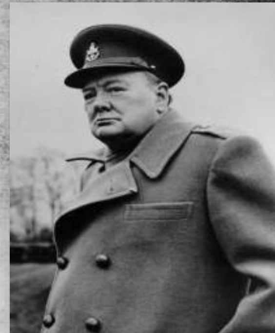
Уинстон Черчилль, премьер-министр Великобритании в 1940—1945 и 1951—1955 годах

Второй фронт нужен был Соединенным Штатам для того, чтобы обустроить выгодные послевоенные позиции по контролю над Европой, над Германией, и через Европу и Германию над остальным миром для того, чтобы приобрести козыри в послевоенном, как считали, торге с Советским Союзом.