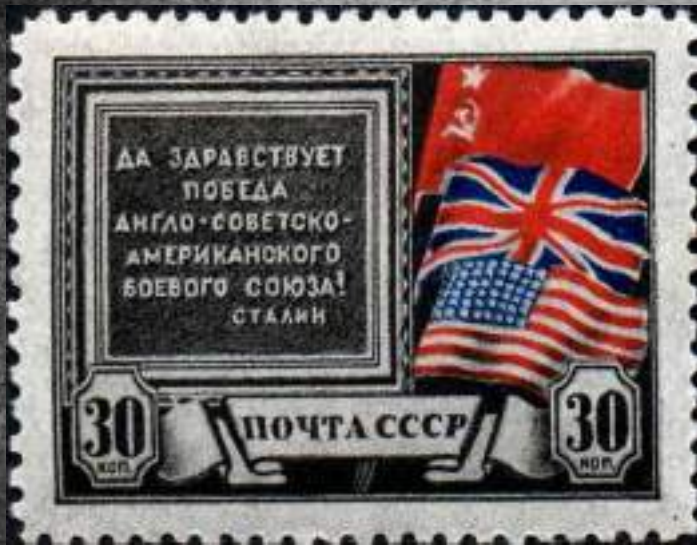
Почтовая марка СССР № 878 1943 г., посвященная Тегеранской конференции 1943 г.