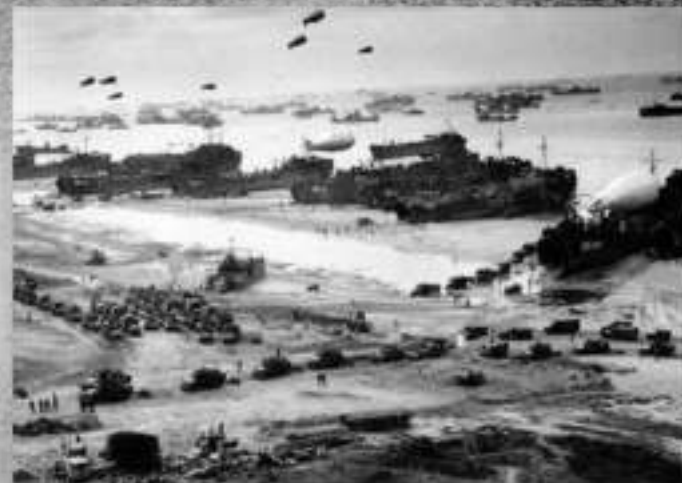
Операция «Оверлорд». Высадка союзных войск в Нормандии. Июнь 1944 г.