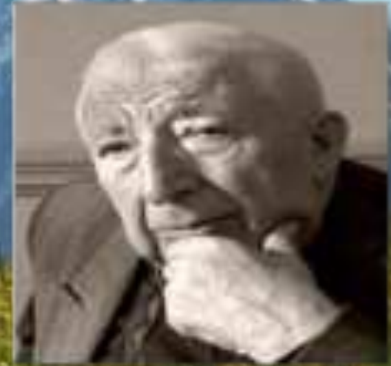
Расул Гамзатов в старости

Он завещал им любить свой край, дорожить им и защищать его. На церемонии прощания с великим поэтом собралось несколько тысяч людей, тело Гамзатова так и несли на плечах до самого кладбища.