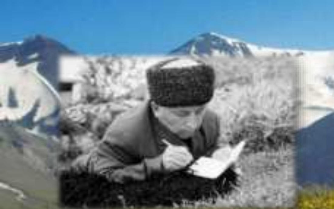
Расул Гамзатов за работой

Мне кажется порою, что солдаты, С кровавых не пришедшие полей, Не в землю нашу полегли когда-то, А превратились в белых журавлей. Они до сей поры, с времен тех дальних, Летят и подают нам голоса. Не потому ль так часто и печально Мы замолкаем, глядя в небеса.