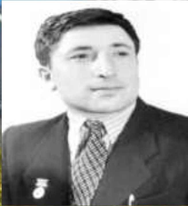
Расул в молодости

Как ни скромна стипендия, а все же Мы были завсегдатаи премьер, Хотя в последний ярус, а не в ложи Ходили, на студенческий манер.