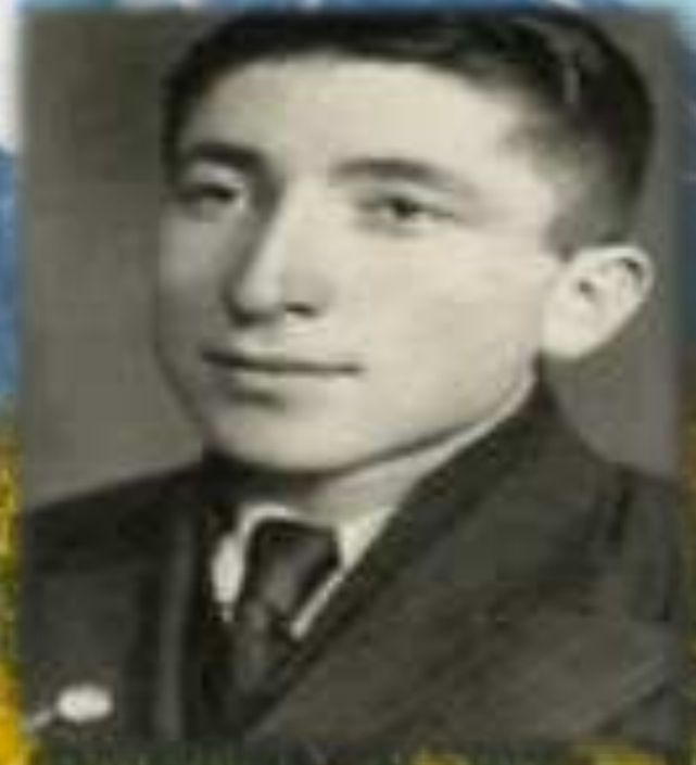
Расул Гамзатов в юности

В 1945 году Расул Гамзатов поступил в Московский литературный институт им. Горького.