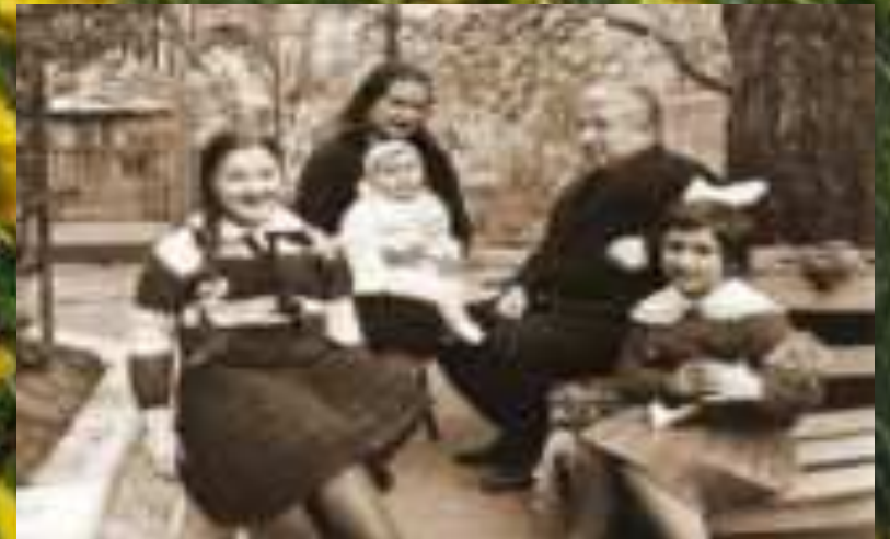
Расул Гамзатов с семьёй