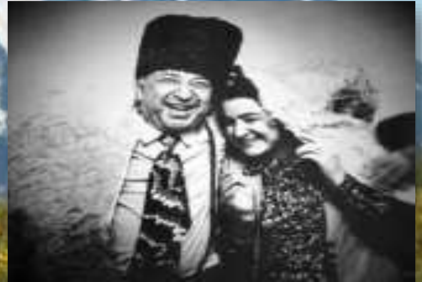
Расул Гамзатов с женой

В том же году Расул Гамзатов стал председателем Союза писателей Дагестана.