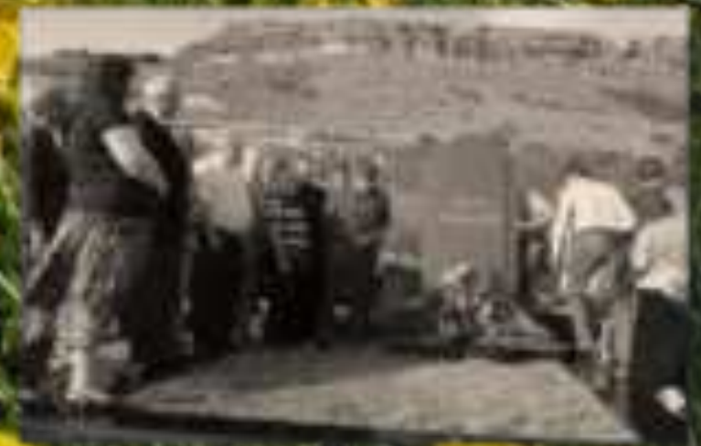
Могила Расула Гамзатова